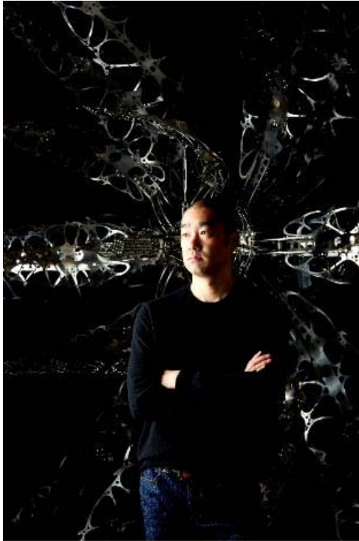
崔吁嵐，金相泰攝。圖片由 MMCA 提供

National Museum of Modern and Contemporary Art, Korea